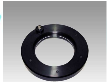
汚れセンサ付き保護ガラスホルダ ® NMI-200 ガラスサイズ: Φ115、3t